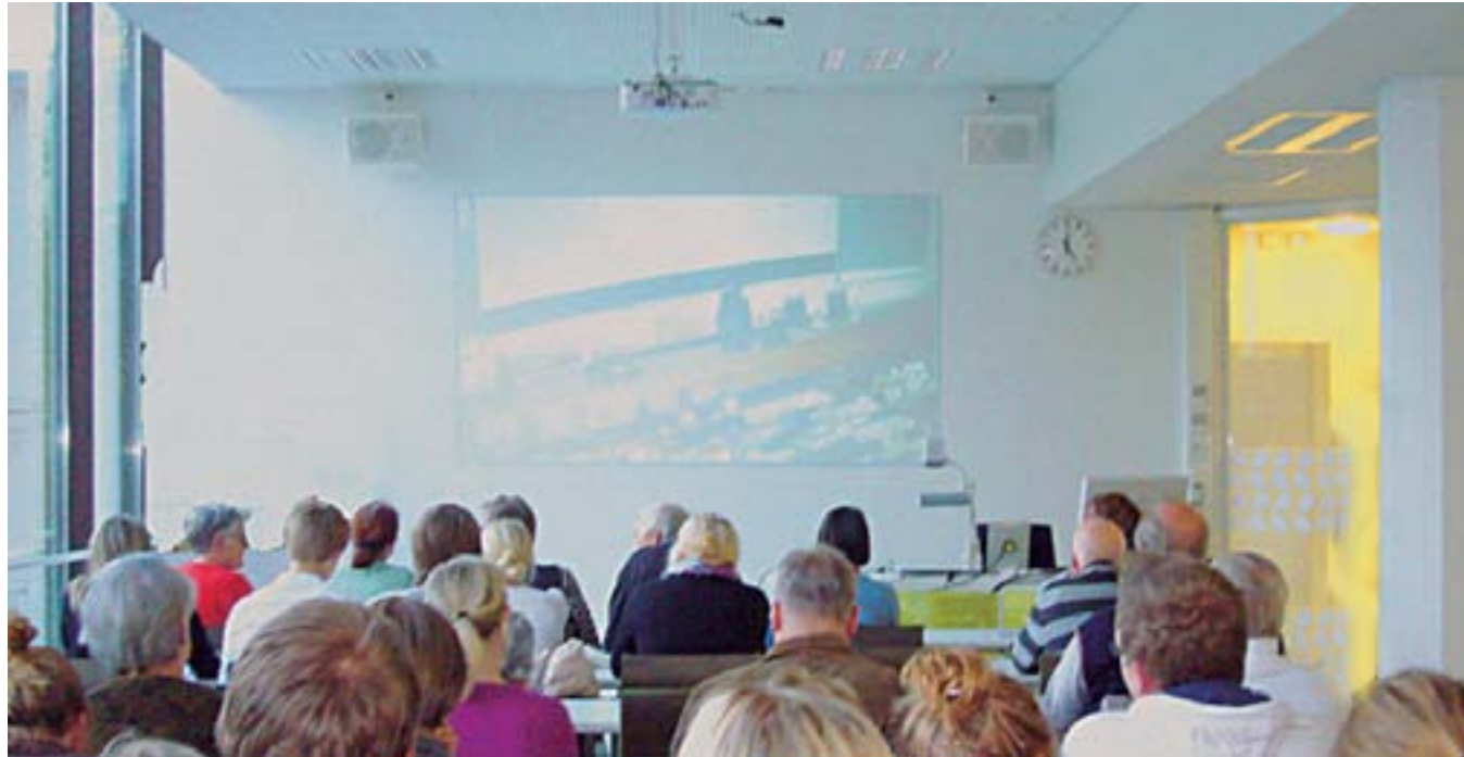
STUDIA GENERALIA -LUENTOSARJAA SEURATAAN TIIVIISTI AC:N VÄLITYKSELLÄ MYÖS LAHDESSA OPPIMISKESKUS FELLMANNIAN TILOISSA.